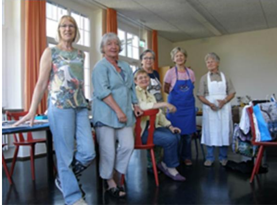
Malkurs in Steinenbronn: die Elevinnen