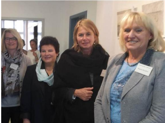
Vernissage Waldenbuch: die Künstlerinnen