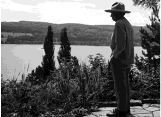
Otto Dix in Hemmenhofen: der Meister