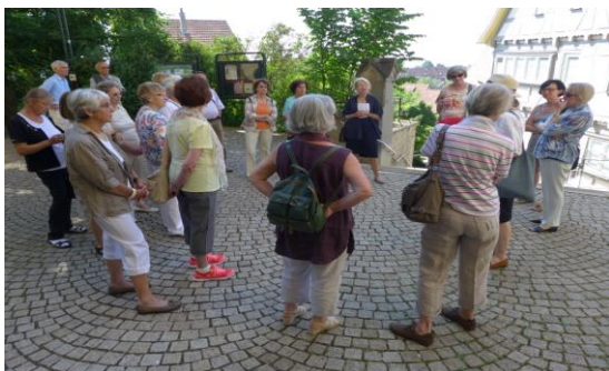
Zuhörerkreis auf Pflasterkreis, Herrenberg 12.6.