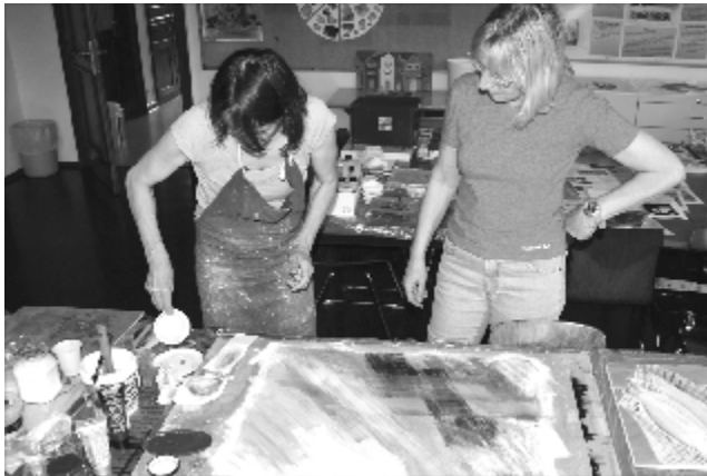
Malworkshop für Mitglieder (2)