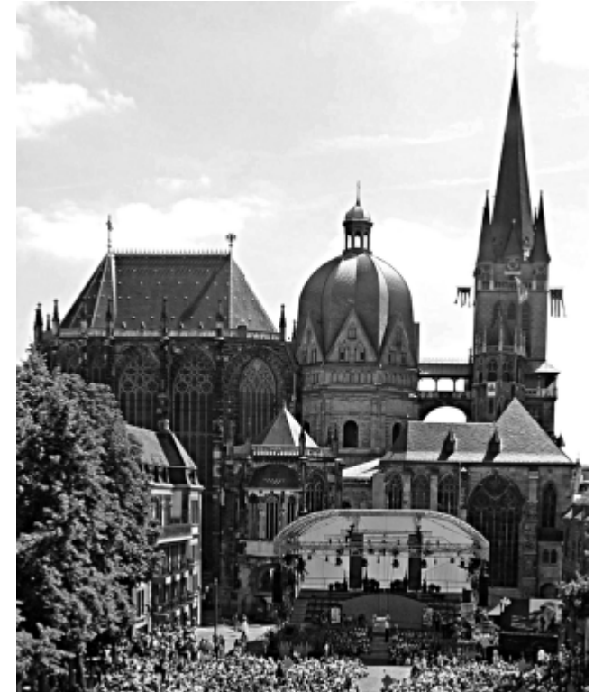
Kunstreise nach Aachen und Brüssel: Aachener Dom (4)